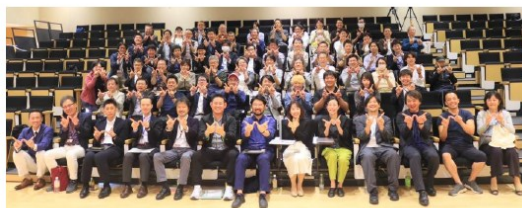
サッポロウォークャブルシンポジウム2024