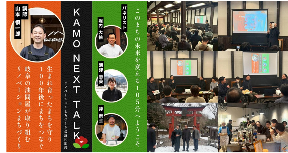
リノベーションまちづくり会議「KAMO NEXT TALK」