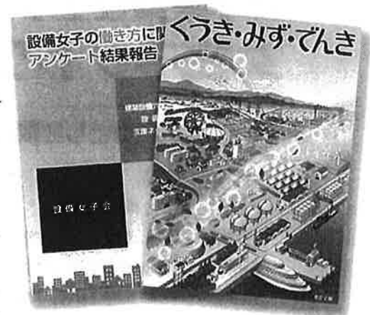
設備女子の働き方に関するアンケート結果報告(左)と、「夏のリコチャレ」にて女子高校生に建築設備の説明に使用した技術絵本(右)