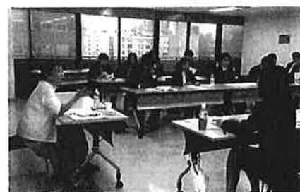
北海道総支部で行った出前講座