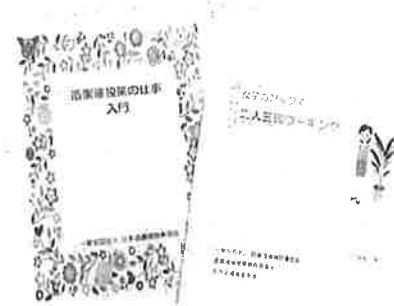
部会活動のアウトプットであり、担い手となる方々への理解を深めるために作成した『造園建設業の仕事入門』(左)と、『女子カアップで二人三脚ワーキング』(右)

Message 我が部会のメンバーはよく働き、よく語り、時には発言がロックな面々。苔など生えようもないピカピカのローリングストーンズ！です。これからの活躍をご期待ください。