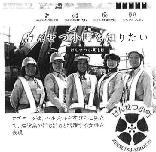
ロゴマークは、ヘルメットを花びらに見立て、建設業で活き活きと活躍する女性を表現

けんせつ小町活躍推進表彰は会員以外の企業も応募できます。日建連の「けんせつ小町ホームページ」では、会員企業の女性活躍制度の事例や、現場環境整備マニュアルなどの情報が掲載されていますので、ぜひご覧ください。