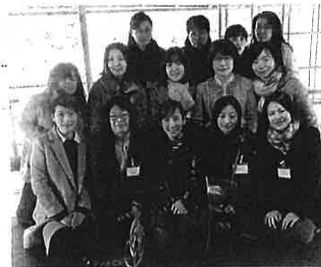
京都の大徳寺孤篷庵で行った勉強会の集合写真