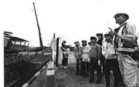
夏休み期間中に、全国 17 箇所で見学会を開催。多くの女性が働いている工事現場を体感した