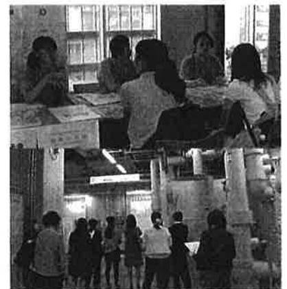
(上)女子高校生に建築設備の世界・建築設備業界について「くうき・みず・でんき」を用いて説明 (下)省エネや CO2 削減など最新の建築設備を備えた施まる設や現場を見学する現場見学会