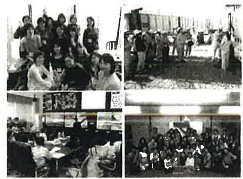
現場見学会や懇親会、他団体や女子学生との意見交換会など数多く開催

土木界で働く女性技術者同士の励ましあいや、知識の向上、また働きやすい環境づくりのため昭和58年に発足した会である。北海道、東日本、中部、西日本の4支部を置き、全国規模で総会や見学会、セミナーなどを多数開催。「ドボジョ」の認知向上に大きく貢献してきた。