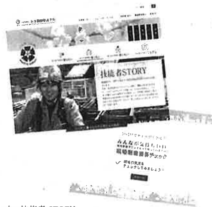
左 技能者 STORY