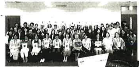
毎年6月に実施される総会では、全国から会員が集う