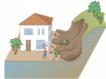
防災上の観点から適正な管理が求められる土地の例(イメージ)

◆「経済財政運営と改革の基本方針2019」(令和元年6月21日閣議決定)(抜粋) ・所有者不明土地等の解消や有効活用に向け、基本方針等に基づき、新しい法制度の円滑な施行を図るとともに、 土地の適切な利用・管理の確保や地籍調査を円滑かつ迅速に進めるための措置 、所有者不明土地の発生を予防するための仕組み、所有者不明土地を円滑かつ適正に利用するための仕組み等について 2020年までに必要な制度改正の実現を目指すなど、期限を区切って対策を推進する。