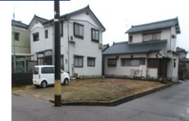
新潟県燕市(土地) 譲渡額約350万円