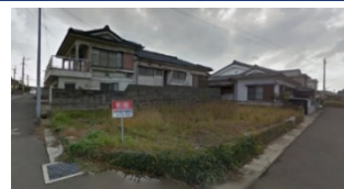
鹿児島県いちき串木野市(土地) 譲渡額約350万円