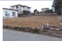
三重県津市(土地) 譲渡額約270万円