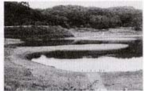
【 飯田ダム (茨城県) 】

整備目標：湿地の再生面積：平成 13 年度 0ha 平成 18 年度 300ha 藻場・干潟の回復面積：平成 12 年度 6.5% 平成 18 年度 19% 港湾空間の緑化率：平成 12 年度 6.9% 平成 18 年度 8%