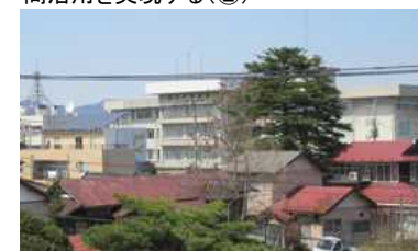
移転予定の総合花巻病院(③)