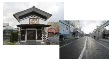
ビジターセンターと上町通り(②)

大堰川プロムナード一体のエリアマネジメントに民間活力を導入し、より有効な空間活用を実現する(②)