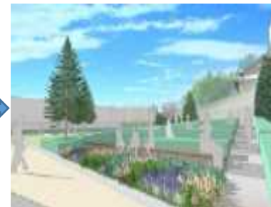
整備後のイメージ