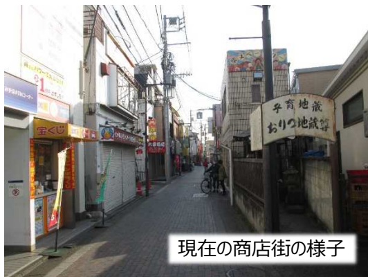
現在の商店街の様子