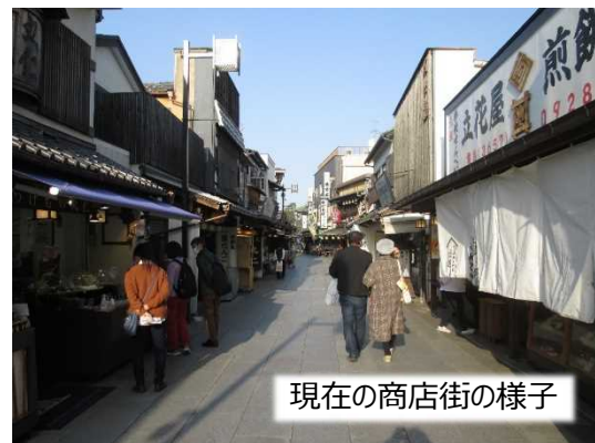
現在の商店街の様子

今後のまちづくりについてお悩みの場合には、お気軽に以下のお問い合わせ先までご相談ください。