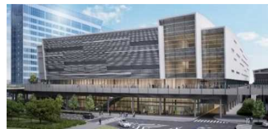
横浜みなとみらい国際コンベンションセンター外観イメージ