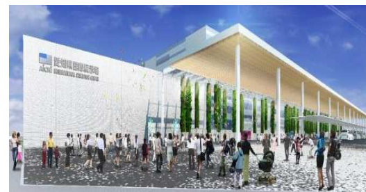
愛知県国際展示場外観イメージ