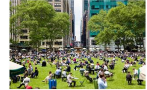
ニューヨーク (プライアント・パーク)