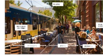
ポートランド (PEARL DISTRICT/パール地区)

・芝生の持つ可能性とその整備・管理のあり方を整理するため、有識者懇談会を令和元年7月に立ち上げ、令和2年3月に「芝生の持つ可能性や整備・管理のあり方についてガイドライン」としてとりまとめ → (9)芝生のチカラの活用